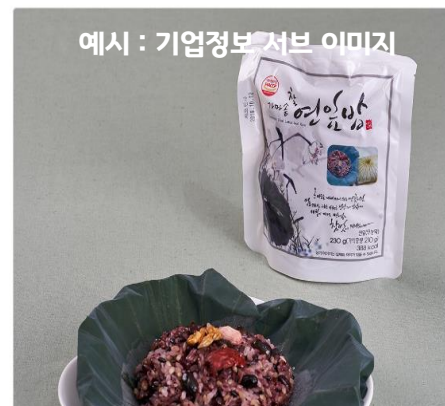
예시 : 기업정보 서브 이미지