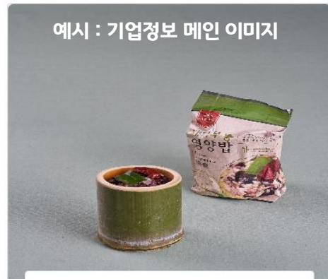
예시 : 기업정보 메인 이미지

밑의 ‘기업정보 메인 이미지’와 ‘기업정보 서브 이미지’는 G-FAIR KOREA 전시회 신규 홈페이지 ( https://gfair.or.kr/biz/main.do )에서 해외바이어/국내MD/일반 참관객 에게 보여 질 대표 이미지 입니다!