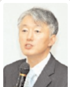
최종학 교수 서울대