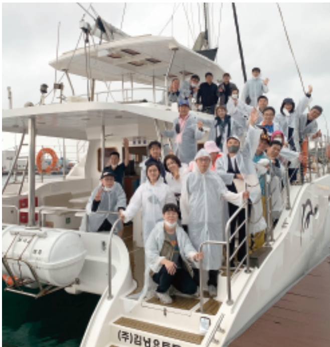
▲ 국내 워크숍