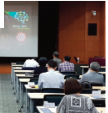
▲ 강의실 전경