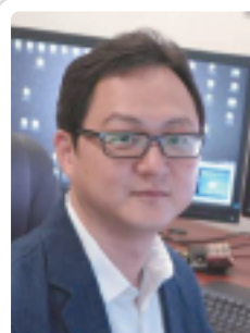
백세범 교수 카이스트