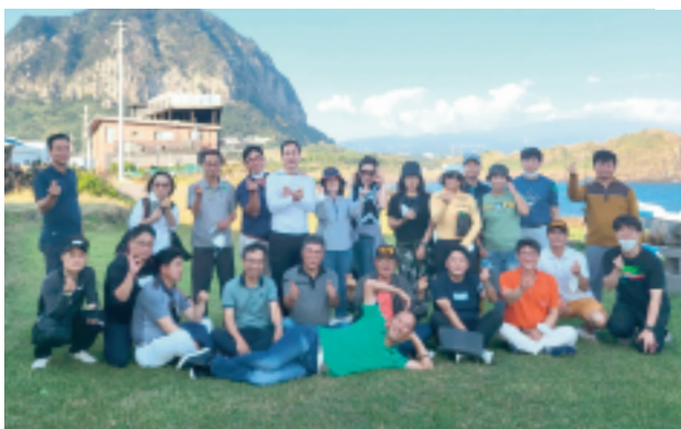
▲ 국내 워크숍